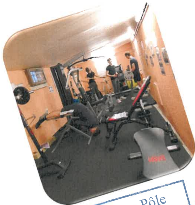
Une salle de sport au Pôle (musculature – Home Trainer)