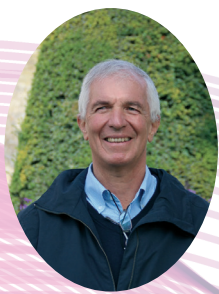
Yves Puret Canal - Jean Jaurès