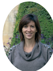
Emilie Debosse Grands Villages

Cour : des 4 Vents. Impasse : Gibault - Serpente - des Varennes. Chemin : des Grainetières. Allée : des Blés d'Or - des Bleuets - des Coquelicots - de la Forêt - des Grainetières - de la Moussière - des Pâquerettes. Rue : du Commandant Georges Aubray - Bâclée - Jean Louis Boncoeur - Bouchacourt - des Buissonnets - de la Cartelée - Georges Clémenceau - de la Creuse - Joachim Du Bellay - Emile Dumas - de la Gare économique - Anthony Gaulmier - Guillon - Hoche - de Juranville (côté pair) - Massena - Jean Moulinb (du 134 au 44 côté pair et du 55 au 41 côté impair) - de Nottuln - d'Ottock - de la petite Bijouterie - Petite rue Baclée - des Prés - des Renardats - Pierre de Ronsard - des Sables - des 3 Sabots - George Sand - des Tilleuls - des Varennes - de Verdun - François Villon. Avenue : Jean Giraudoux (du 504 au 390 côté pair et du 539 au 397 côté impair) - de Meillant (côté pair) - de la République - du 1 er Régiment d'Infanterie (du 57 au 29).