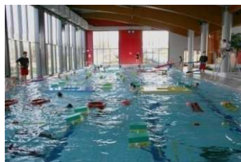
Centre aqualudique Balnéor