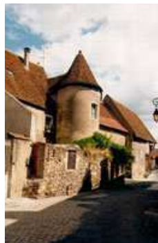
La ville historique

Ouvert de 10h à 12h et de 14h à 17h tous les jours, Tarifs : 6 € / adulte, 4 € / enfant (4-12 ans), 18 € / famille, Exposition temporaire : 3 € www.cite-or.com