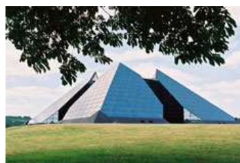
La Cité de l'Or