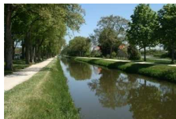
Canal de Berry