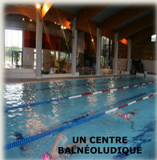
UN CENTRE BALNÉOLUDIQUE