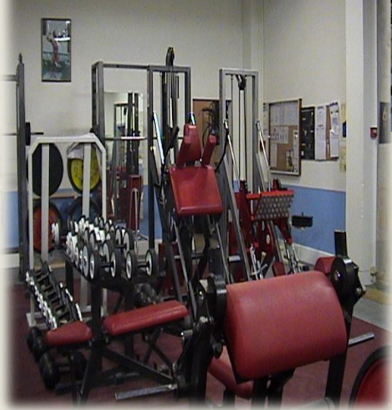
UNE SALLE DE SPORT