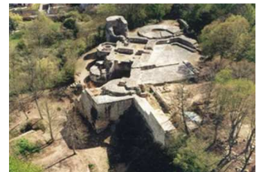
La Forteresse de Montrond